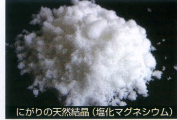
にがりの天然結晶(塩化マグネシウム)

天外天天然にがりに使われる、塩化マグネシウム結晶は海拔四千米、空気の澄みきったチベット高原で露天掘りされます。